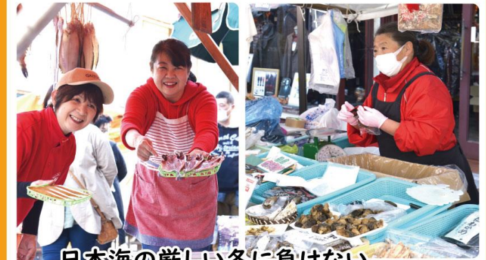
日本海の厳しい冬に負けない、 変わらぬ人情と笑顔が此処にはある。